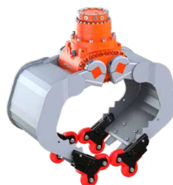
optionale 4-Grip Ansteckvorrichtung, hier angebaut an einem A06HPX