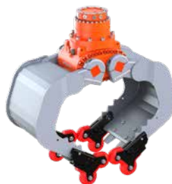
optionale 4-Grip Ansteckvorrichtung, hier angebaut an einem A06HPX