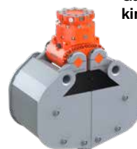
Kostenlose Garantieverlängerung kinshofer.com/service