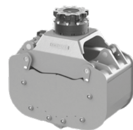
Option: anschraubbare Seitenwände