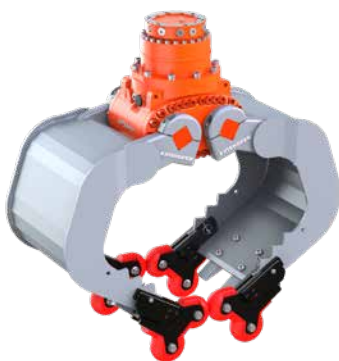
optionale 4-Grip Ansteckvorrichtung, hier angebaut an einem A06HPX